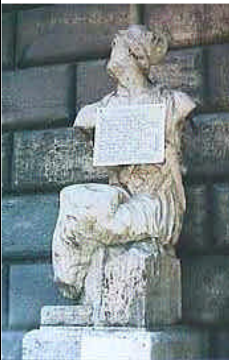
Pasquino: la statua si trova su un lato di Palazzo Braschi a Roma, vicino a Piazza Navona.

poter pubblicare un testo di sana satira politica per la mancanza di una semplice "firma". Un particolare che un certo "Forattini" non ha mai trascurato di apporre sotto le sue vignette di satira politica e che lo ha portato ad essere ricco, famoso e qualche volta anche.... querelato. Pasquino è tornato.