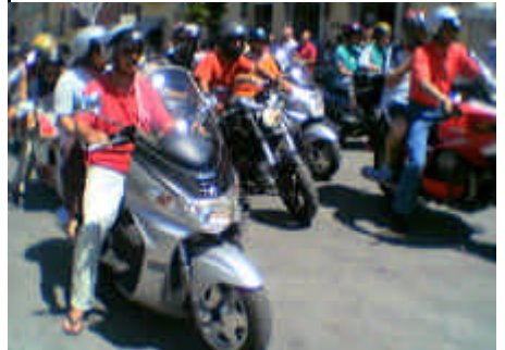
Motoraduno: Parte la sfilata per le vie del paese

Anche in quell'occasione furono organizzati dei festeggiamenti, fu apposta una lapide sul prospetto della casa natale del