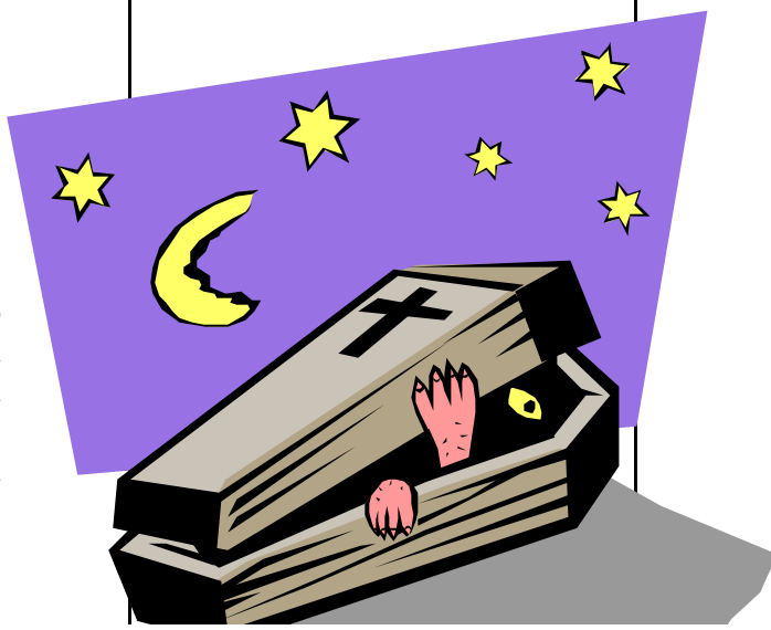
Per rispetto alle famiglie altavillesi non sono state usate fotografie

mercato come impresa concorrente. Non deve essere nascosto che la nuova iniziativa imprenditoriale, nel campo delle onoranze funebri, viene accolta con grande favore da parte della popolazione che vede nell'iniziativa un naturale calmiera delle tariffe che, sempre più spesso, fanno piangere ben oltre il dolore della scomparsa del caro congiunto. In quegli anni, l'allora Sindaco Filomena Caruso, per dei lutti in famiglia, tocca con mano una realtà fino ad allora sconosciuta, vede con i propri occhi un vorticoso giro d'interessi commerciali che vengono sempre più alimentati dalle disgrazie e dal dolore della gente. Turbamento ed indignazione sono fusi