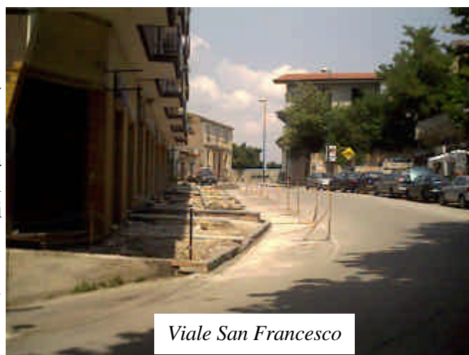
Viale San Francesco

vedrò il termine dei lavori prima della fine della mia sindacatura”. Intanto qualche lamentela arriva dalla ex zona containers: “i lavori iniziano troppo presto, non si può riposare” riferisce una signora di via Eduardo De Filippo. Effettivamente anche negli uffici comunali il lavoro dei pochi impiegati presenti viene disturbato dal rumore e nonostante il caldo le finestre devono essere tenute chiuse per alleviare il disagio. Ma quando nasce l’esigenza d’imprecare, il pensiero di una nuova Altavilla fa dimenticare il caldo ed il rumore e l’imprecazione si spegne.