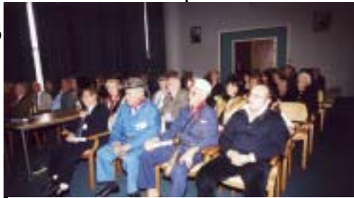
Marcinelle (Belgio) : Minatori superstiti

Austria, presso l'Università di Innsbruck (8 giugno). In quest'ultima manifestazione mi sono soffermato anche sulla nuova ricchezza della Valle del Sabato, il Greco di Tufo , partendo dalla vecchia ricchezza, lo zolfo. E Tufo, solo per un fatto geografico, resta l'epicentro della Valle anche per il nuovo progetto elaborato dalla Comunità Montana del Partenio e dalla Provincia di Avellino, sul parco minerario e le vie del vino. Qualcosa si muove. E' lecito nutrire un ragionato ottimismo. La trasformazione della realtà sociale non può essere opera calata dall'alto, ma conquista diretta delle popolazioni interessate attraverso le istituzioni locali.